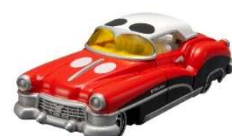
2代目「ドリームスターⅡ」

大人の女性向けモデル「ディズニーマーターズ ジュエリーウェイ」は、ジュエリーのようにキラキラな女の子たちの夢をそっとしまっておける車としてデザインしました。ジュエリーウェイは全部で5種類、すべての車の屋根などがジュエリーボックスのように開閉し、中に小物が収納できます。