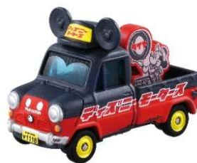
「ソラッタ ミッキー・マウス」