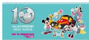
『ディズニーモーターズ』10周年ロゴ・キービジュアル