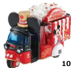
「ドゥービー ミッキー・マウス 10thアニバーサリーエディション」