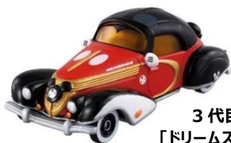
3代目フラッグシップカー 「ドリームスターⅢ ミッキー・マウス」