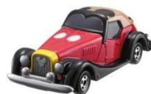
初代「ドリームスター」

5年後、「ドリームスターⅡ」はアメリカンラグジュアリータイプのデザインにフルモデルチェンジしました。